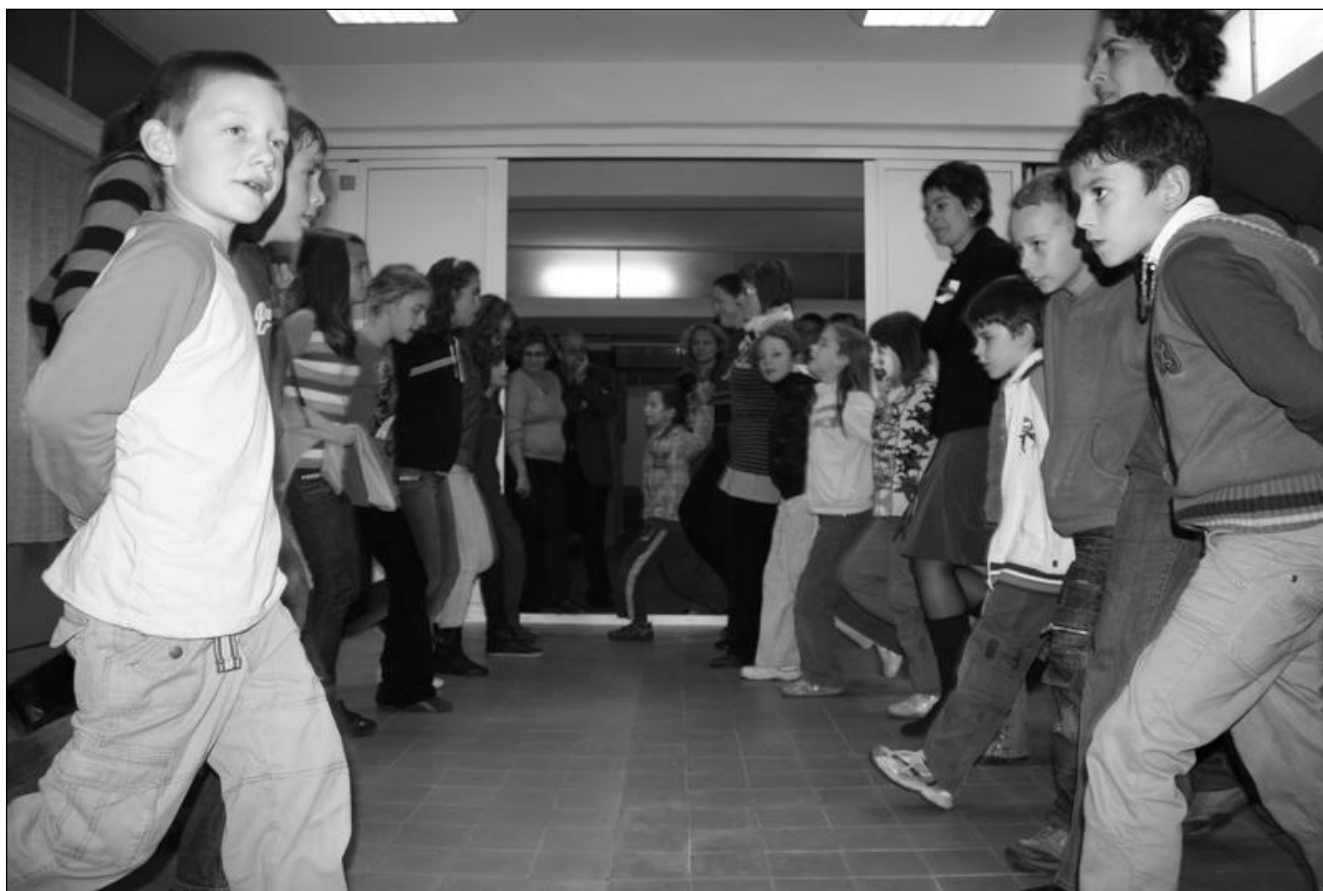
Kicsik és nagyok ropják a táncot a családos nap alkalmából.